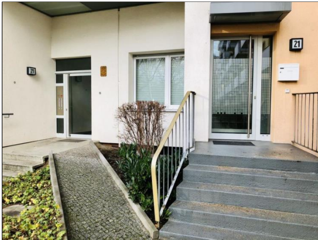
Hauseingang Nr. 21