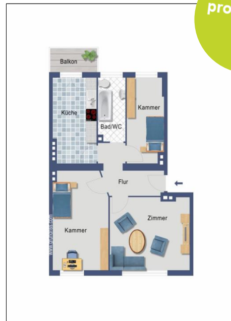
Ollenhauer Str. 91 WE 89