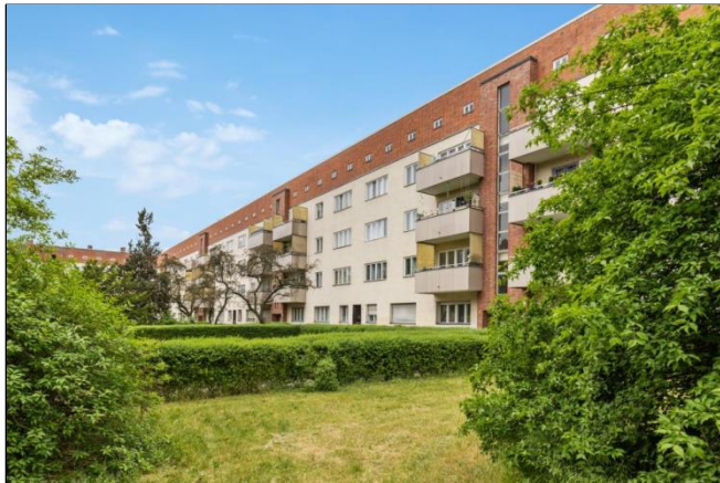
Ollenhauer Straße 85-96

Ollenhauerstraße 91 - 13403 Berlin Objekt-ID: 38965-89