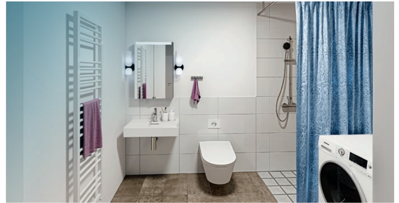
Bad ohne Hindernisse: Bodengleiche Duschen durchdachte Ausstattung. (Illustration, gezeigte Gegenstände sind nicht Vertragsbestandteil)

Aktuell fallen die Gerüste am fertigen Gebäude. Wenn die letzten Streben zurückgebaut sind, beginnen die Arbeiten an den Balkonen: Jede Wohnung bekommt einen eigenen Balkon, im Dachgeschoss bieten moderne ausklappbare Cabrio-Fenster den gleichen Komfort. Auch im Innenbereich wird fleißig gewerkelt. Derzeit stellen die Trockenbauer die letzten Arbeiten fertig. Direkt im Anschluss werden die Sanitäreinrich-