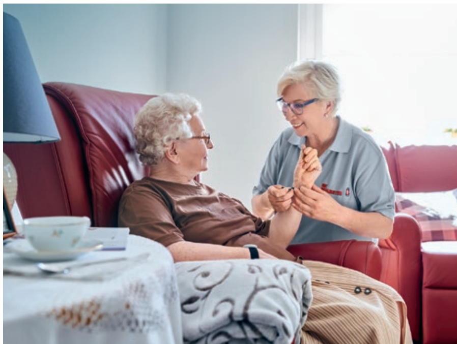
Im Erdgeschoss des Neubaus am Kohlweg bietet die Johanniter Unfallhilfe Unterstützung und ein buntes Programm.

Im Erdgeschoss des Neubaus am Kohlweg bietet die Johanniter-Unfall-Hilfe Unterstützung und ein buntes Programm