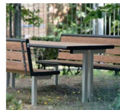
Platz zum Verweilen: Vier Innenhöfe haben neue Sitzgruppen bekommen

Gemeinsam mit den fleißigen Kolleginnen und Kollegen vom Vonovia Wohnumfeldservice arbeiten wir daran, dass die Innenhöfe attraktiv und grün bleiben: Pflanzlücken bei Hecken und Schadstellen im Rasen sollen zeitnah gefüllt werden. Wir sind bemüht, alle Arbeiten rasch umzusetzen, sind jedoch in der Planung auch abhängig von der Witterung, um den neuen Pflanzen möglichst gute Anwuchsbedingungen zu bieten. Natürlich umfassen die Grünvorhaben auch die straßenseitigen Außenflächen an den Gebäuden. Und auch die jüngeren Bewohnerinnen und Bewohner im Quartier kommen nicht zu kurz