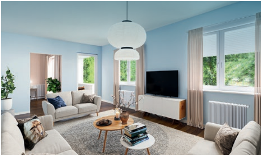
Hell und einladend – das sind die Wohnungen im Neubau (Illustration)

Leipzig · Juli 2022 · Nr. 3 · Jahrgang 2