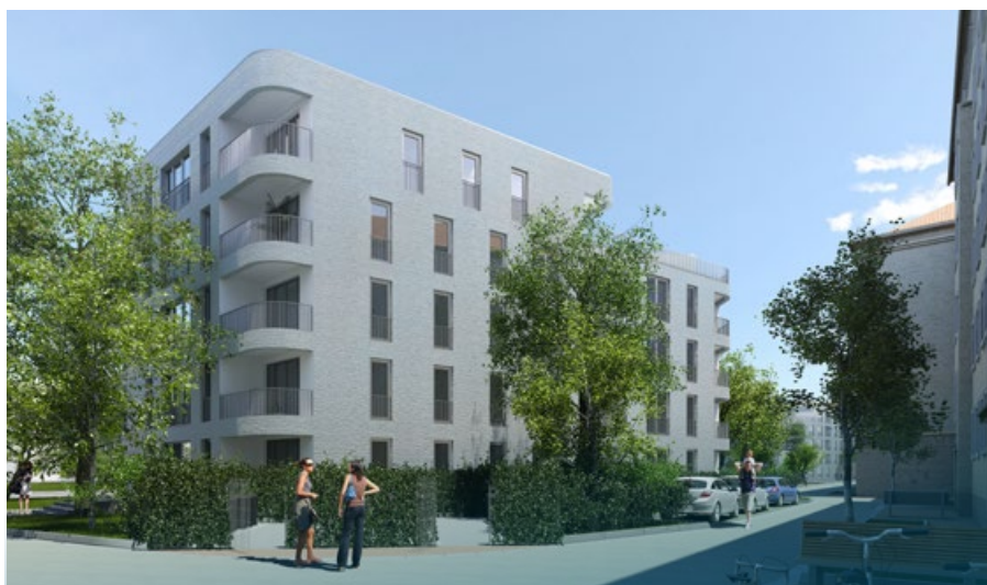
Ein Blick in die Zukunft: So werden die neuen Wohngebäude aussehen. (Modelldarstellung)